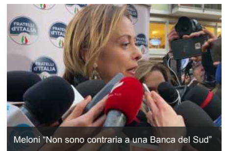
Meloni "Non sono contraria a una Banca del Sud"